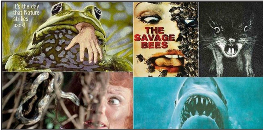
شكل (2) استخدام أفلام الرعب الحيوانات والحشرات لإثارة الرعب والخوف لدى المشاهدين

Source: John Petkovic(2018). Killer frogs and the crazy rise of animal rebellion eco-horror movies