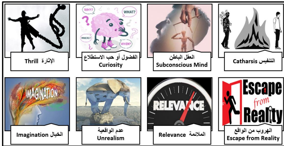
شكل (4) عوامل ونظريات نفسية تفسر جاذبية فيلم الرعب - اعداد الباحثة -

في حين ربط Park بين نظرية الجشطالت وإدراك الجمهور لمشاهد أفلام الرعب حيث يدرك الإنسان الأشياء في كليتها بدلاً من إدراكها كأجزاء، ويعيد الدماغ ترتيب تلك الأشياء بصرياً لفهمها، فيما يُعرف "الكل أكبر من مجموع أجزائه" فمثلاً إذا كان مشهد ما يصور فتاة على قمة مبنى والمشهد التالي يُظهر الفتاة مستلقية في الشارع، فإن الجمهور يستنتج تلقائياً سقوط الفتاة من المبنى؛ فلم ير الجمهور سقوط الفتاة ولكن وفقاً لنظرية الجشطالت فإن عقولنا تملأ المعلومات المفقودة. (Park, 2018)