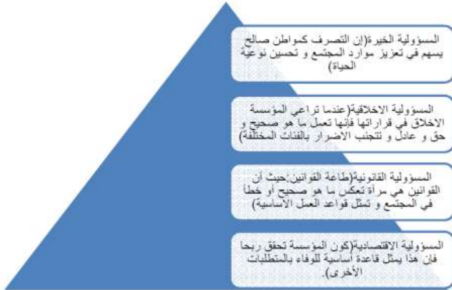
شكل رقم (1) هرم كارول (Carroll) للمسؤولية الاجتماعية

المصدر: مقدّم، وهيبية، تقييم مدى استجابة منظمات الأعمال في الجزائر للمسؤولية الاجتماعية- دراسة تطبيقية على عينة من مؤسسات الغرب الجزائري، رسالة دكتوراه غير منشورة، جامعة وهران، الجزائر، 2014، ص80.