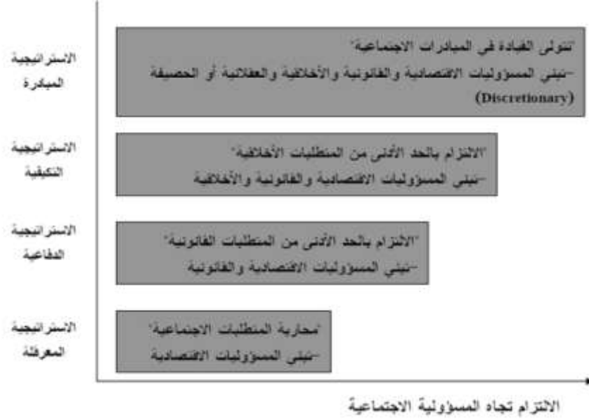
شكل رقم (2) استراتيجيات المسؤولية الاجتماعية