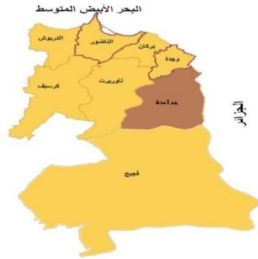
الشكل رقم 1: موقع جرداة على مستوى جهة الشرق

تَشكّل موقع الدراسة الميدانية ومجتمعها من جرداة التابعة للجهة الشرقية بالمغرب (60 كلم 2 جنوب مدينة وجدة) التي تتسم بمناخها المتوسطي بالشمال، والصحراوي بالجنوب، وبامتداد المناطق السهبوية وشبه الصحراوية في جنوب الجهة ووسطها. فجرداة، بوصفها منطقة منجمية تتسم بطابعها الجبلي ومناخها البارد والقارس شتاءً، الحار والجاف صيفاً. وإذا كان عدد سكان الجهة الشرقية يبلغ حوالي 2,314,346 نسمة، فإن ساكنة جرداة تحتل ضمنها 43,506 نسمة حسب الإحصاء الرسمي لسنة 2014 بالمغرب. أما مساحتها فتبلغ 9300 كلم 2 .