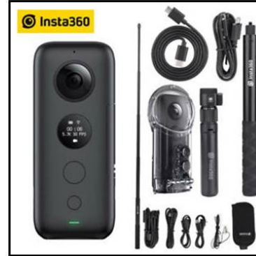
شكل (7) يوضح كاميرا Insta360 One

تتميز الكاميرا بتصميمها الرائع الذي يسمح بتثبيتها وحملها، كما تتميز بوضع Free Capture الذي يسمح للمستخدمين بالتصوير بمجال رؤية 360 درجة قبل تحويله لمقطع تقليدي بنسبة 16:9، وتأثيرات Bullet Time والتي تستخدم في التصوير البطيء بمعدلات إطار عالية.