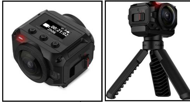
شكل (4) يوضح كاميرا Garmin VIRB 360 وتحتوي على أربعة ميكروفونات تنتج صوتا واضحا حتي تحت الماء، وتضم نظام تحديد المواقع.

الحاجة للهاتف، كما يمكن التحويل بين وضع التصوير الثابت والفوتوغرافي بضغط بسيطة، بينما يستخدم تطبيق الهاتف الذكي في تصفح الصور ونقلها بين الأجهزة المختلفة. ومن مميزات الكاميرا أنه يمكنها بث الفيديو الحي بدقة 4K، كما أنها تتمتع بمكونات داخلية وشرائح ممتازة بالإضافة لحجمها الصغير كما أنها تأتي بحامل ثلاثي القوائم، ومن عيوبها أن تكلفتها عالية وتم إزالة منفذ Mini HDMI منها. ويمكنها تصوير مقطع فيديو مدته 25 دقيقة متصل، كما يمكنها تسجيل الصوت المحيطي بمجال 360 درجة بفضل الميكروفونات الأربعة المدمجين بها لمدة 80 دقيقة، تعمل بنظام أندرويد ومزود بمعالج كوالكوم Snapdragon 625، كما تم تطوير خاصية استقرار الصورة البصرية في هذه الكاميرا، وتدعم البلوتوث والواي فاي ويمكن التحكم بها عن بعد عن طريق تطبيق خاص بها. شكل (5).