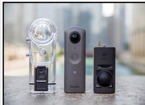
شكل (5) يوضح كاميرا Ricoh Theta V

وتصور بدقة 5.2K ومجال رؤية 360 درجة، لذلك فهو خيار ممتاز من الصعب منافسته. دقة تصوير الفيديو القصوى للكاميرا هي 2624×5228 بكسل بمعدل 30 إطار في الثانية، أو يمكنها التصوير بدقة 3K بمعدل 60 إطار في الثانية، أما دقة الصور الثابتة 18 ميغا بكسل، وعمر بطاريتها 70 دقيقة. شكل (6).