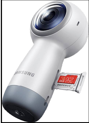
شكل (8) يوضح كاميرا Samsung Gear 360

دقة الفيديو: 4K بطاقة الذاكرة MicroSD : التركيب والتثبيت: حامل ثلاثي عمر البطارية: 130 دقيقة تشبه كاميرا Samsung Gear 360 كاميرا Theta V إلى حد كبير على مستوى الإمكانيات مع اختلاف التصميم الذي يشبه الروبوتات التجارية. وتتميز الكاميرا بشاشة صغيرة يمكن من خلالها التنقل بين أوضاع التصوير الثابت، تسجيل الفيديو، تايم لاب، الفيديو الحلقي ووضع HDR للصور العريضة. قد لا تكون جودة تصوير الفيديو في هذه الكاميرا هي الأفضل ولكنها لا تزال قادرة على المنافسة بقوة. شكل (8).