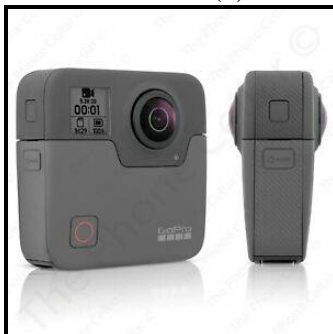
شكل (6) يوضح كاميرا GoPro Fusion

وتصور بدقة 5.2K ومجال رؤية 360 درجة، لذلك فهو خيار ممتاز من الصعب منافسته. دقة تصوير الفيديو القصوى للكاميرا هي 2624×5228 بكسل بمعدل 30 إطار في الثانية، أو يمكنها التصوير بدقة 3K بمعدل 60 إطار في الثانية، أما دقة الصور الثابتة 18 ميغا بكسل، وعمر بطاريتها 70 دقيقة. شكل (6).