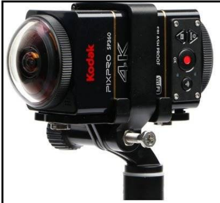
شكل (9) يوضح كاميرا Kodak PixPro SP360 4K

تزن 128 جرام، وتمتلك دقة تصوير فيديو قصوى 2880×2880 بمعدل 30 إطار في الثانية، ودقة صور ثابتة 12 ميغا بكسل، وعمر بطارية 55 دقيقة. مميزاتها أنها تمتلك تصميم قوي وصلب، وعمر البطارية معقول، لكن عيوبها أنه يلزم كاميرتين منها لتصوير مجال رؤية 360 درجة. في بعض الأحيان يكون مجال الرؤية 235 درجة أكثر من كافي، وهذا هو السبب أن تلك الكاميرا تمتلك عدسة كروية واحدة فقط، وتأتي بهيكل مقاوم للصدمات، ومقاوم للتجمد، ومقاوم للغبار ومقاوم للرذاذ، ومزودة بتقنيات اتصال الواي فاي و NFC وتأتي مع العشرات من الملحقات، وذلك يوضح سبب السعر المرتفع، كما يمكنك التحكم بها عن بعد عن طريق الهاتف، وتحميل الفيديو هات على اليوتيوب والفيسبوك. شكل (9).