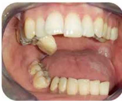
Fig. 4.a : Ajustage du plan de guidage : ouverture buccale.

La confection de l'appareil guide commence par la réalisation d'une plaque palatine en résine transparente par la technique classique de saupoudrage en respectant les limites préalablement dessinées sur le modèle de travail en l'occurrence au-dessus des cingulums des dents au niveau antérieur et au-dessus de la ligne du plus grand contour au niveau postérieur. Des crochets façonnés sont ajoutés