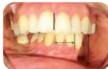
Fig. 1b : Examen endo-buccal