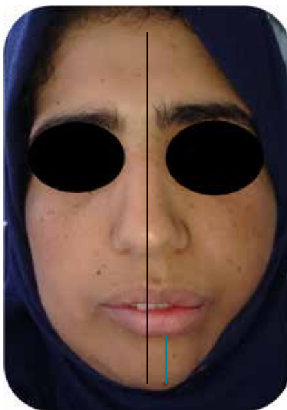
Fig. 1a : Examen exo-buccal

À travers, une situation clinique prise en charge à l'Unité de Prosthodontie Maxillo-Faciale du Centre de Consultation et de Traitement Dentaire (CCTD) de Rabat, nous allons essayer de mettre le point sur les différentes étapes cliniques et de laboratoire, de réalisation d'un appareil guide mandibulaire suivi