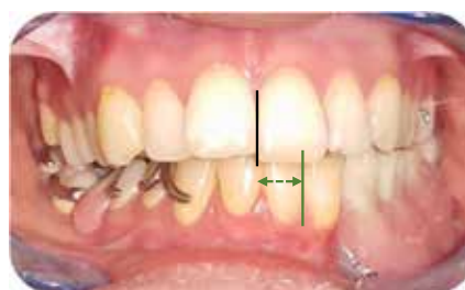
Fig. 9 : Insertion en bouche.

résiduelles et déchargeant le libre jeu des structures musculaires et muqueuses environnantes. En effet, juste une petite raquette d'extension au niveau de la zone du defect, permettant de soutenir le matériau d'empreinte et le modelage, sans pour autant empiéter sur les tissus moux, est largement suffisante en l'occurrence (Fig. 5).