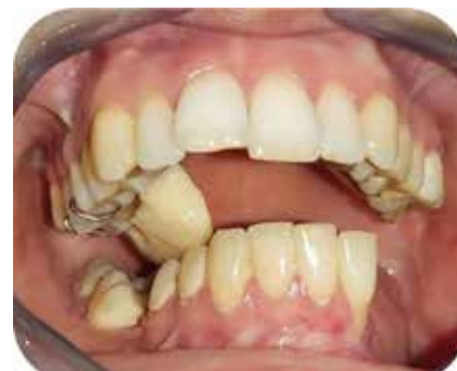
Fig. 4.b : Ajustage du plan de guidage : Premier contact dents/plan de guidage.