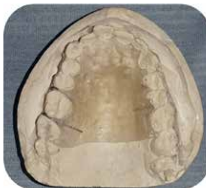
Fig. 2 : Plaque palatine.