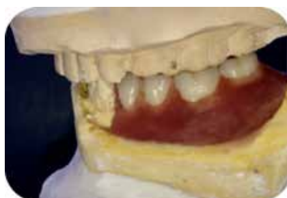
Fig. 8 : Montage des dents prothétiques 3HM.