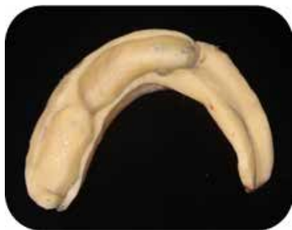
Fig. 5 : PEI adapté à la perte de substance.