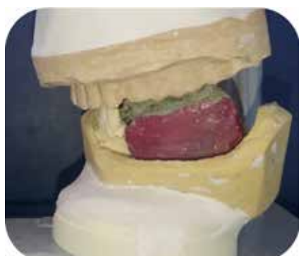
Fig. 7 : Transfert sur articulateur du RIM.