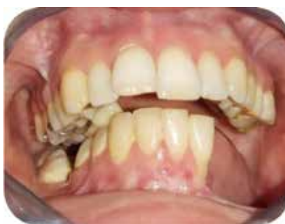
Fig. 4.c : Ajustage du plan de guidage : fermeture buccale.