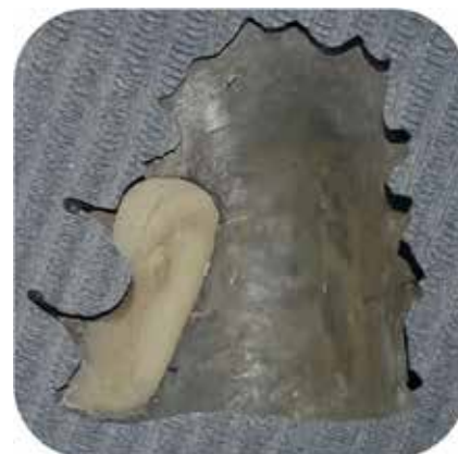
Fig. 3 : Plaque avec le plan de guidage.

d'une prothèse dentaire amovible conventionnelle spécifique.