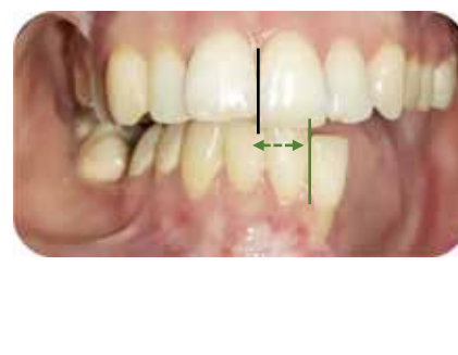
Fig. 4.d : Ajustage du plan de guidage : occlusion à la position mandibulaire la plus centrée.

pour la rétention (Fig. 2). Un bloc en résine Unifast® est mis sur la plaque du côté opposé à la perte de substance (Fig. 3), il sera en guise de plan guidant le glissement de la mandibule vers une position plus centrée dans le plan sagittale médian (Fig. 4a, 4b, 4c et 4d). Ce plan sera modifié au fur et à mesure jusqu'à l'obtention de la position la plus centrée de la mandibule sans déplacement du fragment mandibulaire pouvant traumatiser les tissus sous-jacent. L'insertion de l'appareil guide s'accompagne de l'élimination des dents de la prothèse mandibulaire qui peuvent bloquer le déplacement de la mandibule.