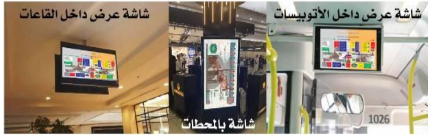
صورة رقم (4) اشكال مختلفة لطرق عرض الحملات التوعوية على شاشات العرض

تصميم الحملات التوعوية المطبوعة ذات اهمية كبيرة في التوعية بعناصر تأمين العملات الورقية المصرية والتي يستخدمها كل الفئات وبخاصة التي لا تستطيع التعامل مع تكنولوجيا الهواتف المحمولة او غير متاحة لها، و يفضل وضع هذه النوعية من الملصقات التوعوية المطبوعة في الأماكن التي يتردد عليها غالبية غير المستخدمين لتكنولوجيا وتطبيقات الهواتف الذكية ككبار السن