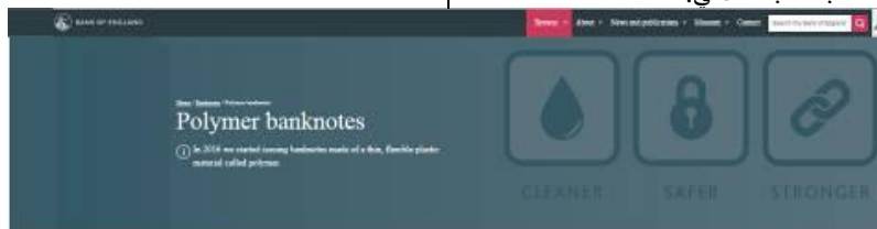
صورة رقم (7) موقع بنك إنجلترا – صفحة اوراق النقد البوليمرية