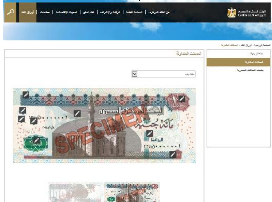
صورة رقم (5) موقع البنك المركزي المصري - صفحة اوراق النقد [5]

تصميم الحملات التوعوية لعناصر تأمين العملات الورقية المصرية على هيئة عروض متحركة تعرض على شاشات العرض الرقمية وشاشات التلفزيون سوف تخدم كل فئات المجتمع حيث تتوفر الشاشات في قاعات الإنتظار بالبنوك والنوادي ومحطات القطار والمترو وقاعات الإنتظار بالمستشفيات والمستوصفات العلاجية وتعد العروض المتحركة من أفضل الوسائل لتوصيل الرسالة التوعوية بوضوح ويسر، مع العلم بأن تكرار عرض الرسالة التوعوية سوف يرسخ في الأذهان الغرض المطلوب من التوعية