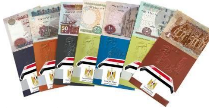
صورة رقم (3) احد اشكال المطبوعات التوعوية بعلامات تأمين العملات النقدية

ومن لم يتوفر لديهم اجهزة هواتف ذكية وتتمثل الاماكن في مكاتب البريد والصحة و التأمينات الإجتماعية وقاعات الإنتظار في البنوك ومحطات القطار والمترو ووسائل النقل العامة والمجمعات الاستهلاكية والنوادي والجمعيات الزراعية. - العروض المتحركة والفيديو على شاشات العرض الرقمية وشاشات التلفزيون