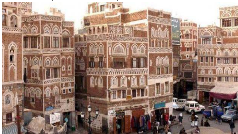
مدينة صنعاء ( عمارة يمنية )