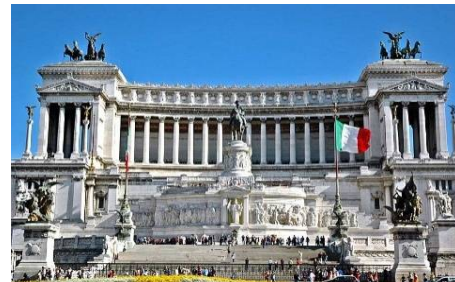
نصب تذكاري فيكتور ايمانول ( عمارة رومانية )