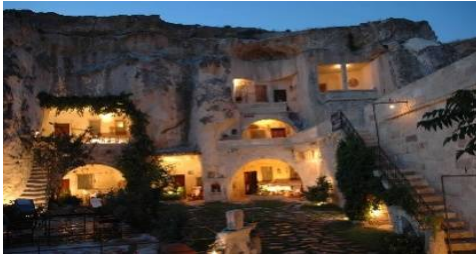
مساكن كبادوكيا ( عمارة تركية )

من مكوناتها الحضارية والثقافية . والمقصود بالهوية المعمارية ليس التفاصيل والأشكال التي يتم غضاقتها للمباني حتى تتمكن من تمييز طرازها ان كان اسلامي او مغربي ولكن يقصد كل ما يعطي البيئة الطابع المميز لها سواء كان عمارة المبنى أو العمران المحيط بها. (1)