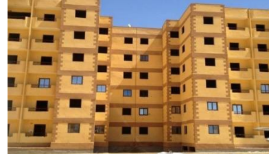
شكل الإسكان الإجتماعي الفاقد للهوية