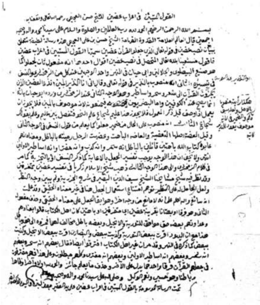
صورة الرسالة المخطوطة