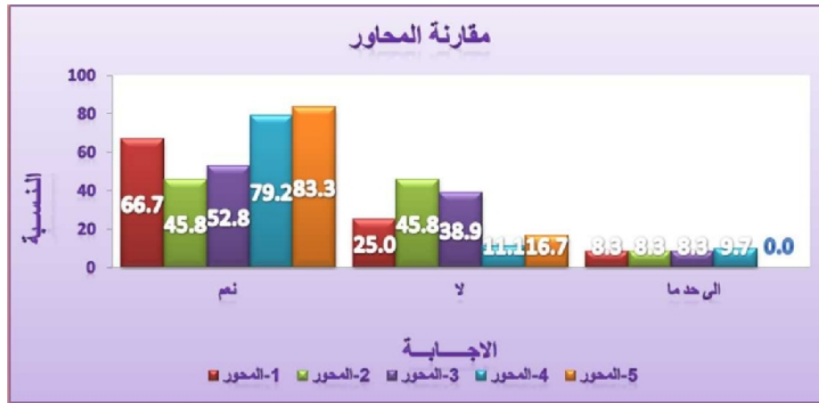
رسم بياني 5. مقارنة نتائج المحاور