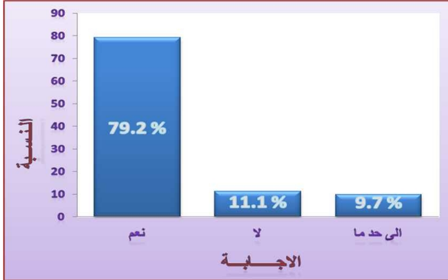
رسم بياني 4. تحليل نتائج المحور الرابع

في الأقمشة من (النعومة ، الانسدال ، درجة البياض، ثبات الأبعاد، مقاومة الكرمشة)، والاهتمام بخدمات ما بعد البيع (التعديل والاستبدال) ، توفر خطط بديلة لمواجهة الطلبات المفاجأة وخاصة في المواسم والأعياد وذلك بزيادة عدد ساعات العمل لتحقيق الربح وكسب ثقة العملاء ، والتواصل المستمر بين المصنع والبائع ، للتعرف على متطلبات المستهلكين يكون من خلال منافذ البيع ، وذلك لأن المستهلك هو العامل الأول لتحديد نجاح أو فشل المنشأة الصناعية ، اعتماد المصانع على الأقمشة المستوردة وجاء ذلك متوافقا مع نتائج دراسة (حجي، 2003م)، وذلك لتوفر الخواص المرغوبة من قبل العملاء في أقمشة الثياب المستوردة.