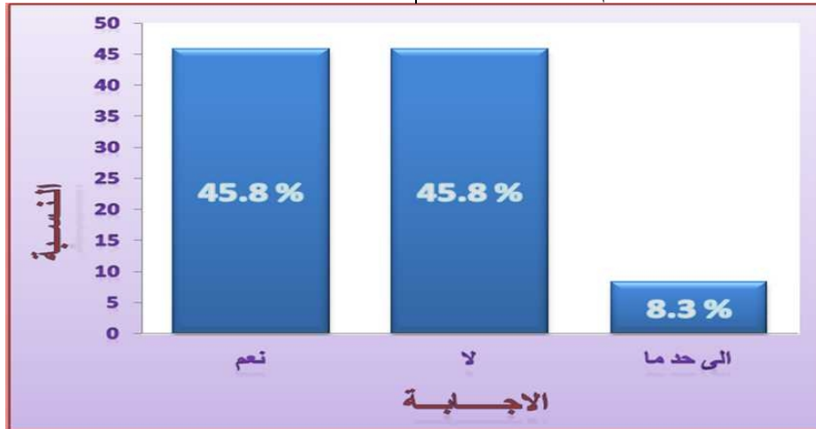
رسم بياني 2. تحليل نتائج المحور الثاني جدول 4. نتائج المحور الثالث (الاهتمام بجودة المطابقة)

تهتم بجودة التطوير ت- 8.3% من عينة الدراسة (الأشخاص) كانت إجاباتهم (إلى حد ما) ... أي أنه 8.3% من عينة المصانع التي شملتها الدراسة تهتم إلى حد ما بجودة التطوير وذلك يدل على أن النسب متساوية بين عينة المصانع التي تهتم بجودة التطوير خلال جميع مراحل الإنتاج وعينة المصانع التي لا تهتم بجودة التطوير خلال جميع مراحل الإنتاج. حيث أن المصانع التي تهتم بجودة التطوير خلال عملية الإنتاج تحرص على توفير الأقمشة المناسبة لذوق المستهلك حيث ذكرت نتائج (حجي، 2003م) أن أهم الخواص التي يحرص المصنع على توافرها في الأقمشة من (النعومة، الانسدال، درجة البياض، ثبات الأبعاد، مقاومة الكرمشة)، ولكن بما أنه لا يوجد مصانع محلية في المملكة لتصنيع أقمشة الثياب الرجالية فيتم توفير الأقمشة من