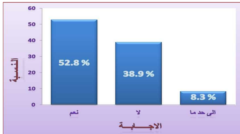
رسم بياني 3. تحليل نتائج المحور الثالث

بجودة المطابقة ت- 8.3% من عينة الدراسة (الأشخاص) كانت إجاباتهم (إلى حد ما) ... أي أنه 8.3% من عينة المصانع التي شملتها الدراسة تهتم إلى حد ما بجودة المطابقة وهذا يدل على أن أغلب المصانع تراعي إنتاج ومطابقة التصميم مع العينة المقترحة من قبل العميل سواء كان التصميم منفذ أو