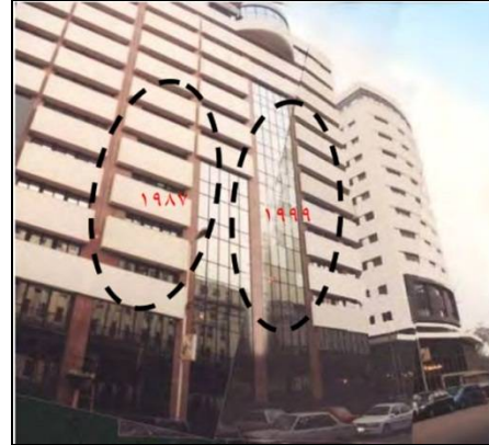
شكل (1) الملحق الجديد لمبنى الأهرام 1987م ، 1999م

مثال : الملحق الجديد لمبنى الأهرام - عام 1999م