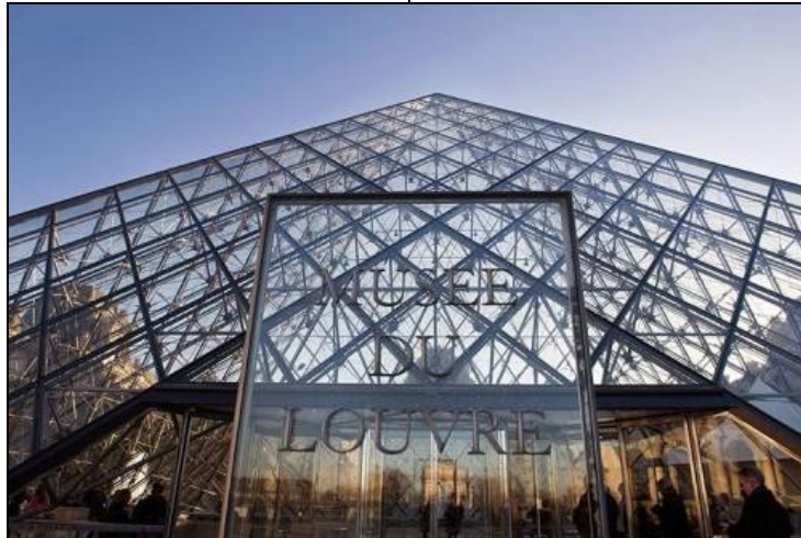
شكل (17) يوضح انعكاس هيئة المبنى التاريخى لقصر اللوفر على اسطح الهرم الزجاجي

وقد واجه المعماري مشكلة كبيرة فى خلق امتداد وإضافة مستجدة لا تضر بالقيمة التاريخية للقصر ، حيث توصل لاستغلال الفناء المركزى الواقع بين أجنحة المتحف وعمل امتداد غير مرئي من