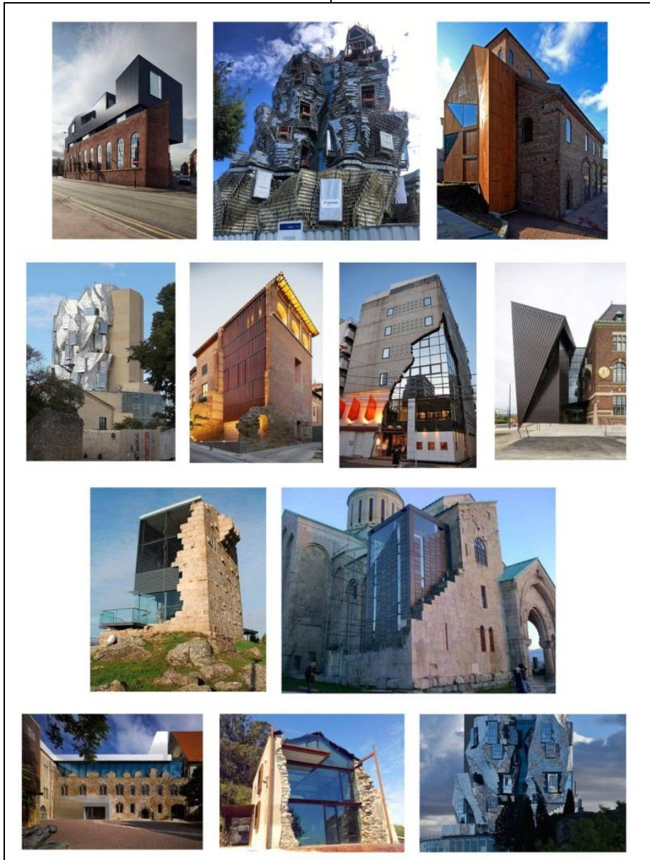
شكل (14) أمثلة معمارية حول العالم توضح الاختلاف بين التشكيل المعماري القائم والمستجد مما أدى الى تباين كلى لكلا التشكيلين

بعد التأثير الطفيف للحركات الحديثة على بيئة المباني فى أواخر