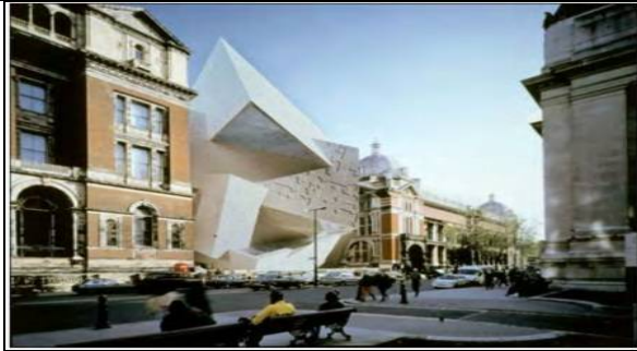
شكل (9) يوضح الإمتداد الحلزوني لمتحف فيكتوريا والبرت ، تصميم دانيال لينسكيند ، لندن

تستخدم هذه الطريقة عند الحاجة الى الإختلاف للتعامل مع تصميم