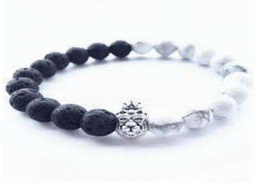
خرز طاقة الشفاء