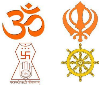
شعار أديان الشرق