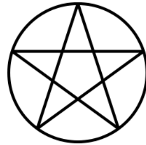
شعار الباطنية في لبنان

وهذه الشعارات تحمل الكثير من الفلسفات الروحانية، والمعتقدات الوثنية، التي قامت على عقيدة وحدة الوجود وتآليه الذات البشرية، وإسقاط التكاليف الشرعية. فلا بد من الاحتساب على مثل هذه الفلسفات، وحماية جناب التوحيد، وكشف مافيه من انحرافات فكرية وعقدية والدعوة إلى التأصيل الشرعي وفق منهج السلف الصالح. وصلى الله على نبينا محمد وعلى آله وصحبه وسلم تسليماً كثيراً.