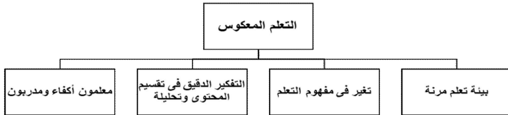
شكل (2) الأركان الأساسية للتعليم المعكوس

المرحلة الأولى في المنزل: يطلع الطالب على المحتوى العلمي الذي أعده المحاضر من قبل وتدوين الملاحظات الخاصة بمقطع الفيديو والمناقشة مع المحاضر عبر الإنترنت قبل الحضور للجهة التعليمية. المرحلة الثانية في الجهة التعليمية: يتم فيها المناقشة العلمية بين المحاضر والطالب في ما يتعلق بمحتوى الفيديو، والقيام بالأنشطة التعليمية المخطط لها مسبقاً وتدوين النتائج من قبل المحاضر .