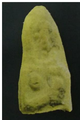
الشكل 9 دمية من موقع شميت

عن: محمد صبري، مصدر سابق، 2014، الشكل 50/هـ.