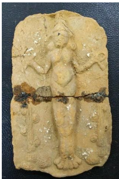
لوح يمثل الإلهة عشتار