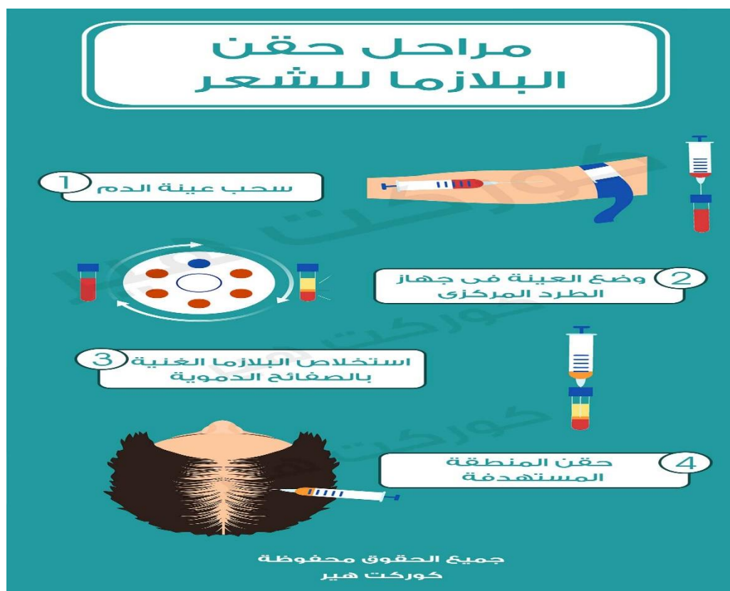
الشكل (٢) (١٦)