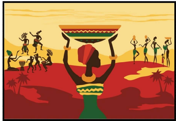
شكل (1) يوضح التصميم الأول