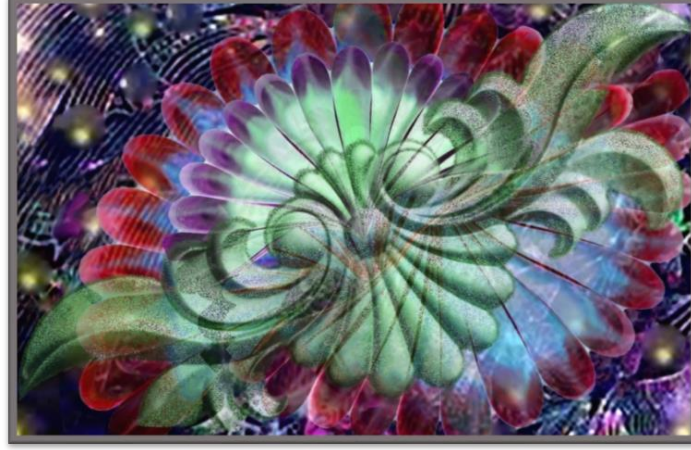
شكل (19) التصميم والمعلق رقم (1)

3- توزيع المساحة بشكل مناسب، متوافق مع متطلبات طبيعة العمل في المنشأة للحفاظ على ممرات حركية بكفاءة ويسر . 4- اختيار الألوان والخامات الملائمة لطبيعة عمل المنشأة سواء كانت إدارية أو تجارية، أو مؤسسة حكومية، أو خاصة. 5- ملائمة ومراعاة السلامة الشخصية عند عمل الديكور الداخلي ، فهي من أهم العوامل التي تجعله ناجحاً وتخرجه بتصميم مميز. ( آلاء دعوع، ١٢ أبريل ٢٠١٧، mawdoo3.com، ج- الحلول الإبتكاريه للدراسة: