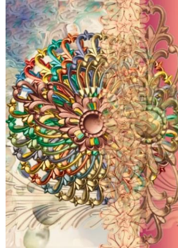
شكل (25) التصميم والمعلق رقم (4)

شكل (23) توظيف الحل الإبتكاري رقم (2) الحل الإبتكاري (التصميم) المعلق رقم (4)