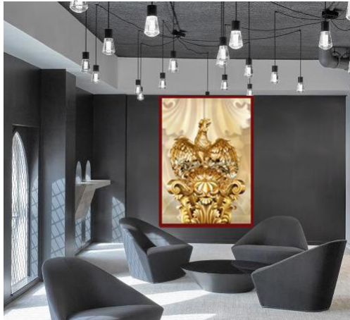
التوظيف : صالة استقبال في منشأة إدارية

شكل (28) توظيف الحل الإبتكاري رقم (5) 16 خالفاً تكويناً زخرفياً كوحدة واحدة مع إضافة الطائر (الصقر) الزخرفي من طراز لويس 16 أيضاً أعلى التكوين مع عنصر