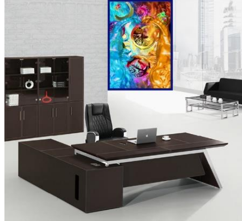
التوظيف: مكتب إداري لرئيس مجموعة من العاملين

الوصاية(ريجنسي) والدوائر الهندسية مع استخدام ألوان ساخنة وبارده معاً وهي:درجات الأصفر الذهبي – التركواز والزهرى – درجات البنى والأخضر- درجات الفوشيه.