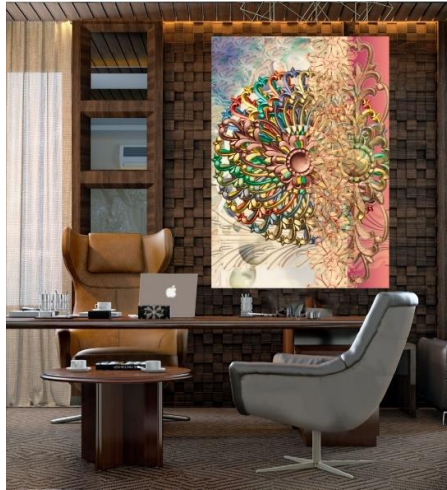
شكل (26) توظيف الحل الإبتكاري رقم (4)

شكل (24) توظيف الحل الإبتكاري رقم (3) التوظيف: مكتب إداري لرئيس مجموعة من العاملين