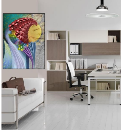
التوظيف : مكتب إداري معاصر لشخص واحد

برزت في طراز لويس 16 مع الزخارف الصدفية والهندسية والنباتية مع استخدام الألوان المعدنية وهي النبتي والذهبي والبنفسجي والأزرق والجنزاري .