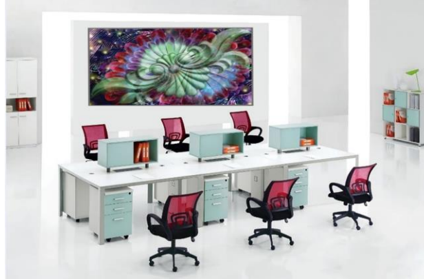
شكل (20) توظيف الحل الإبتكاري رقم (1)

أعتمدت الباحثة في بناء التصميم على العناصر الصدفية المميزة لفن الروكوكو والتي تميز بها طراز لويس 15 وعمل وحدة زخرفية مستلهمة منها وتحويرها وأستعمالها كمحور مائل في التصميم، مع إستخدام مجموعة لونية ذات شفافية وهي: الأحمر-