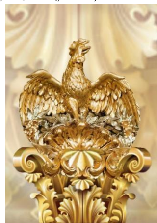
الحل الإبتكاري (التصميم) المعلق رقم (5)

شكل (27) التصميم والمعلق رقم (4) أستوحت الباحثة الفكرة التصميمية عن طريق الدمج بين مجموعة من الزخارف النباتية وجزء من أوراق الأكانثا من طراز لويس