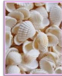
شكل (1) يوضح بعض الأصداف

يخطئ الكثير حين يظن أن فن "الروكوكو" أحد الفنون المعاصرة الغير شائعة وليدة العصر الحديث، ولكن الحقيقة أنه ينتمي إلى الفنون التراثية الأوربية التي عرفت بعصور النهضة، فهو ثالث هذه العصور الفنية الهامة ذو الأصول الكلاسيكية، بما في ذلك الرسم والديكور والعمارة والأدب والموسيقى والمسرح. وهو آخر طراز فني شامل في أوروبا الغربية نشأ وتطور في فرنسا ثم أخذ ينتقل في جميع أنحاء أوروبا خاصة ألمانيا وإيطاليا والنمسا، مشاع بين جميع الفنانين الموهوبين منذ 1715م إلى 1781م أي خلال القرن الثامن عشر. (artsofrenaissance.com)