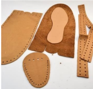
صورة (2) مكونات حذاء الإليو الرجالي

ولحذاء الإليو أنواع كثيرة حيث مر بالعديد من التطورات علي مر التاريخ وباختلاف الثقافات والمنشأ، إلى أن اتخذ في الوقت الحاضر شكل حذاء مصنوع من الجلد الناعم، يتكون من نعل وجوانب مُفصلة من قطعة واحدة من الجلد، تجمع معًا بواسطة الحياكة من أعلى مع الجزء العلوي (الفرنشة) (vamp)، صورة (2)، وتختلف أنواع الإليو في بعض الخصائص، إلا أنها تتفق في أغلب الصفات كالراحة والمرونة وسهولة الاستخدام؛ إذ أن حذاء الإليو بدون رباط أو وسيلة غلق مما يعني أنه سهل الارتداء والخلع، كما أنه ذو جوانب منخفضة فيكشف جزء من الكاحل ولا يلتف بشكل محكم حوله كالأحذية ذات الأربطة.