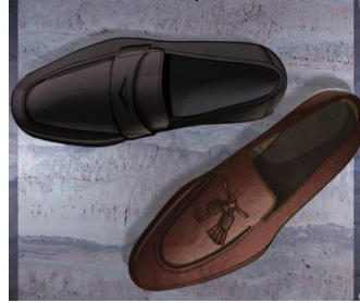
صورة (5) حذاء إليو اللوفر (Hwang Jung-sun, 2014, 353) (post.html)