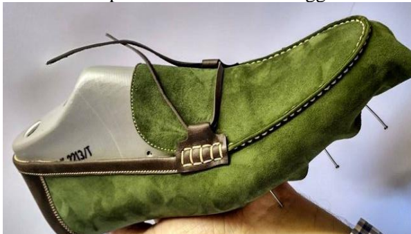
صورة (3) حياكة الإليو على شكل حرف (U)

(https://www.pinterest.com/pin/439101651051638)