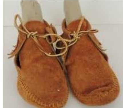
صورة (1) الأصلي لحذاء الإليو

حذاء الإليو الذي يعرف أيضًا باسم الموكاسين (moccasin)، هو نوع من الأحذية أتى إلينا من الهنود الحمر،