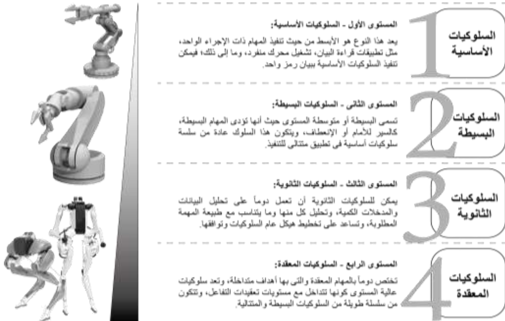
شكل (3) مستويات سلوك الأنظمة الروبوتية داخل تجربة التفاعل (adapted from: Peters & Schaal, 2006; Rapp, Tirassa, & Ziemke, 2019)

وتعرف حالة الوجود Presence على أنها حالة التواجد المادي أو الحضور الفيزيائي داخل بيئات التفاعل المختلفة المادية والافتراضية، ودمج التمثيلات الافتراضية داخل سياق مشترك بين الأفراد والمنتجات، وهي تُعبر عن حالة نفسية يُفضل فيها المستخدم إختبار الأشياء والمنتجات المادية - شبه الأصلية أو