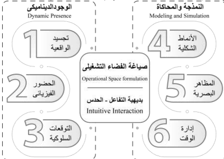
شكل (4) عناصر صياغة الفضاء التشغيلي لتشكيل هيكل التفاعل (adapted from: Dawood, 2021, pp. 166-169)

تفاعلات الفضاء التشغيلي دون حدوث إضطرابات في ديناميكيات تفاعلات النظام الحالي، ولكي تبدو الروبوتات أكثر واقعية لابد من إظهار قدرتها على التعبير ومشاركتها التعاطف من أجل تنبؤ البشر لأفعالهم بطريقة منطقية، وكذلك واقعية إستخلاص بعض المعايير والمؤشرات الإجتماعية المرتبطة بالبشر؛ فعند أخذ بيئة التفاعل الحقيقية في الإعتبار يتطلب ذلك تحقيق الحد الأدنى من التكامل مع النموذج الديناميكي للروبوت ذات التفاصيل الغنية (Krach, et al., 2008).