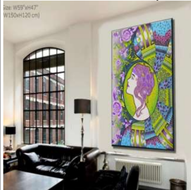
شكل (١٥) التوظيف الافتراضى المقترح

بعد إجراء التأثيرات المختلفه على التصميم المبتكر بواسطه الملامس والفلاتر الموجوده فى برامج الحاسب الالى الحديثه تبين تغير فى بعض الألوان مما ساعد على تعميق اللون الازرق وتفتيح الأسود مع وجود بعض التأثيرات عليها وإختلاف بعض الدرجات اللويه وظهور ملامس مختلفه داخل المساحات اللويه الأخرى مثل التى توجد على اللون البنفسجى لاحداث التجسيم كما يوضح شكل (١٤) ويوضح شكل (١٥) التوظيف الافتراضى المقترح للحل الابتكارى .