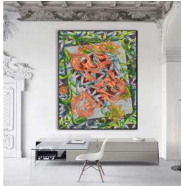
شكل (١٨) التوظيف الافتراضي المقترح.