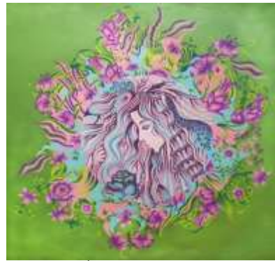
شكل (١٥) التصميم الأصلي