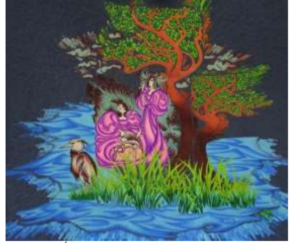
شكل (١٩) التصميم المعلق بعد إجراء التأثيرات

تغير في بعض الألوان مما ساعد علي تعميق بعض الالوان وتفتيح الوان اخرى مع وجود بعض التهشيرات وظهور ملامس مختلفه داخل المساحات اللونه الاخرى والخلفيه مثل التي توجد على اللون الاخضر والبنّي مما تعطي أحساس بالبعد الثالث للعناصر كما يوضح شكل (١٩) ويوضح شكل (٢٠) التوظيف الافتراضي المقترح للحل الابتكاري .