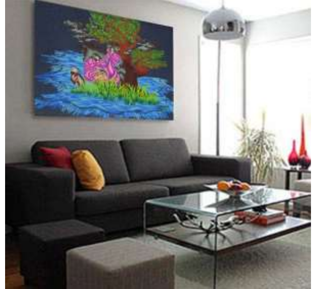
شكل (٢٠) التوظيف الافتراضي المقترح

ثانيا: التصميمات المبتكره من عناصر الفن الزخرفي Art Deco والتوظيف الافتراضي المقترح