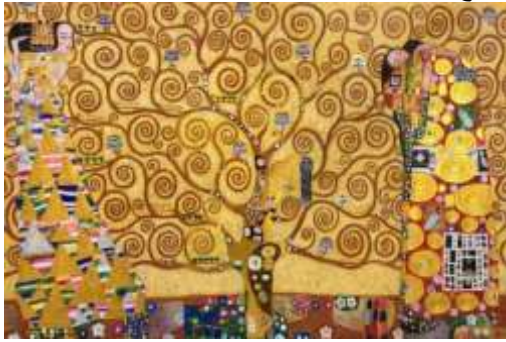
شكل (٦) احد اعمال الفنان جوستاف كليمت عام ١٩٠٩م باسم شجرة الحياه

بينما من الناحية اللونية فقد استخدم الفنان اللون الذهبي وهو اللون الرئيسي للوحة بكونه اللون البارز والظاهر في البقعه الرئيسييه في التصميم. وقام الفنان ايضا باستخدام درجات الابيض والاسود داخل المستطيلات الموجوده باحجام مختلفه على ملابس الرجل حيث هذا التنوع في الحجم يعطي احساس بالاتزان بينما المرأه يظهر على ملابسها دوائر ملونه ومتنوعه الحجم ايضا مما يدل على تأثره بالفن المصري القديم . كما يتحقق في هذا التصميم الإيقاع عن طريق الإيقاع الحر والذي تختلف فيه شكل الوحدات عن بعضها البعض اختلافا تاما وبالتالي تحققت الوحدة مع التنوع عن طريق ترابط الأشكال مع اختلاف حجمها لاحداث ترابط فني.