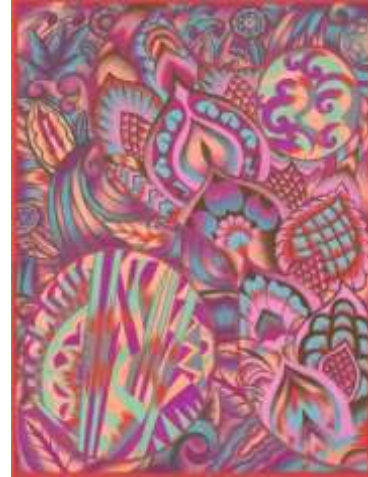
شكل (٢٤) التصميم الأصلي

يستوحى هذا التصميم من دمج الزخارف الهندسيه مع العناصر النباتيه التي تميل للهندسيه والتي توجد داخل الدائرتين والزخارف النباتيه ذات الشكل الهندسي المستوحاه من الفن الزخرفي الارث ديكو وقد تم تنظيم وتوزيع تلك العناصر التشكيليه حيث تضفى التنوع في المساحه ويقوم البناء التشكيلي لهذا التصميم على التنوع بين العناصر الهندسيه لعمل تكوين مبتكر يمزج بين جماليات الأشكال الهندسيه والوحدات الزخرفيه والعناصر النباتيه معا ، أما المجموعه اللويه فقد أستخدمت الباحثه مجموعه من الألوان مع بعض التهشيرات والتسيح للالوان وهي درجات البنفسجي ودرجات الازرق الفاتح ودرجه الاصفر الفاتح والتطعيم البسيط باللون البني الغامق كما يوضح شكل (٢٤).