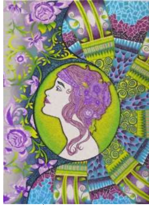
شكل (١٤) التصميم المعلق بعد إجراء التأثيرات