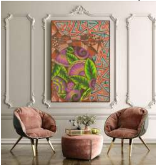
شكل (٢٣) التوظيف الافتراضي المقترح.

تغير في بعض الألوان مما ساعد علي تعميق بعض الالوان وتفتيح الوان اخرى مع وجود بعض التهشيرات وظهور ملامس مختلفه داخل المساحات اللونه الاخرى والخلفيه مثل التي توجد على اللون الاخضر والبنّي مما تعطي أحساس بالبعد الثالث للعناصر كما يوضح شكل (١٩) ويوضح شكل (٢٠) التوظيف الافتراضي المقترح للحل الابتكاري .