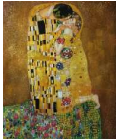
شكل (٥) احد اعمال الفنان جوستاف كليمت عام ١٩٠٧م باسم القبلة

وقد تميز كليمت بأسلوبه واعماله الزاهيه ذات الالوان المشعه والتي تجمع بين النزعة التعبيرية ورمزية التزيين فنجد ان كليمت اهتم كثيرا برسم جسد المرأه فالمرأه تعتبر عنصر اساسي في معظم لوحات وجداريات واعمال جوستاف كليمت, مما جعل الكثير يطلقون عليه نقاشا ويقدموا له العديد من الانتقادات نظرا لجرأته ولهذه الجرأه اصبح اسلوبه فيما بعد واحدا من اهم المدارس الفنيه, ولقد تمرد كليمت على القواعد والأساليب التقليدية التي كانت راجحة في عصره وكان مناصرا قويا لأساليب الفن الحديث فأكد مدير متحف "belvedere" أن غوستاف كليمت بلا شك أيقونة الفن الحديث وانه واحد من أعظم الرسامين المزخرفين في القرن العشرين , وتأثر كليمت ايضا برسم الاشكال او الشخصيات مع دمج بعض الزخارف التي استنبطها من الفنان المصري القديم, حيث تمتع بشهرة كبيرة فأصبح أحد أبرز الفنانين في فيينا وكانت اعماله الفنيه معروفه برمزيته الشديده وصوره المثيرة. أصيب كليمت بجلطة مفاجئة شلت حركته وأضعفت قواه ليتوفى بعدها بشهر عن عمر الخامسة والخمسين عام, عام ١٩١٨م. ومن ثم سوف نتقدم بأشهر الاعمال الفنيه للفنان النمساوي جوستاف كليمت .