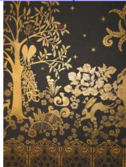
شكل (٤) احد اعمال المصمم ألبرت راتو Albert Rateau عام ١٩٢٢م

https://modernism.com/items/39/posters/619-548-original-french-art-deco-poster-maurice-lauro