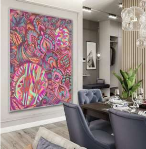
شكل (٢٦) التوظيف الافتراضي المقترح.