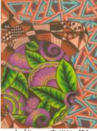
شكل (٢١) التصميم الأصلي

بعد إجراء التأثيرات المختلفه علي التصميم حدث تغير طفيف في شكل التصميم وحدث تغير اكبر في الالوان الخاصه به عن التصميم الرئيسي حيث تغير اللون البنّي خلف المتلثات تماما حيث يظهر باللون البيج مع تهشير بسيط باللون البنّي وايضا يوجد تهشير بسيط على المتلثات في وضع افقي على اللون الازرق وايضا وجود بعض الملامس على اللون البرتقالي والبنفسجي لإحداث شكل جمالي مختلف كما يوضح شكل (٢٢) ويوضح شكل (٢٣) التوظيف الافتراضي المقترح للحل الابتكاري.