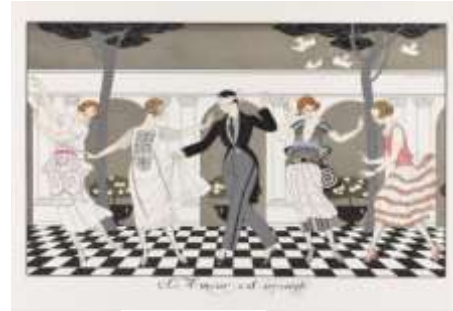
شكل (٩) احد اعمال الفنان جورج باربييه تحت عنوان الحب

بعد جورج باربييه أحد أعظم الرسامين الفرنسيين في أوائل القرن العشرين. ويشتهر بأعماله الأنيقة في فن الأرت ديكو "Art Deco" التي تأثرت بشدة بالاستشراق والأزياء الباريسية. ولد جورج باربييه في مدينة نانت بفرنسا عام ١٨٨٢ ، وكان يبلغ من العمر ٢٩ عاما عندما اقام معرضه الاول في عام ١٩١١م والذي كان مصدر شهرته واشتهر جورج باربييه أيضًا بكونه أحد " فرسان السوار " وهي عباره عن مدرسة للفنون الجميلة أطلق عليها Vogue لقب " فرسان السوار " تكريما لسلوكياتهم العصريه والمتألقة وأسلوب ملابسهم. فكان يتميز بأسلوب حياته واعماله الرائعه والتصميمات التي قام بها للمسرح والسينما والباليه, وحتى اليوم تحظى رسوماته الحديثه والعصريه بشعبية في جميع أنحاء العالم. وقام ايضا بتصميم المجوهرات والزجاج وورق الحائط وكتب العديد من المقالات لجريدة Gazette du bon ton المرموقة. وفي منتصف العشرينات من القرن الماضي عمل مع Erté وهو اسم مستعار يعتمد على النطق الفرنسي للأحرف الأولى من اسمه وهو مصمم فرنسي روسي لتصميم مجموعه من الأزياء Folies Bergère وحقق شعبية كبيرة من خلال ظهوره المنتظم في مجلة Elle وهي مجلة فرنسية عالمية تركز على أزياء المرأة , وتوفي باربييه في ١٦ مارس ١٩٣٢م في ذروة نجاحه , فيما يلي سوف نتقدم بأشهر اعماله الفنيه .