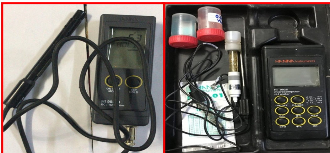
صورة (١) جهاز قياس الـ PH